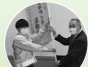
除雪ボランティア隊 結団式

12月8日今年も湯沢市除雪ボランティア隊の結団式を行いました。 12月28日現在、湯沢市内5中学、1高校、13の企業団体、個人1名の方々500名が登録しております。対象世帯は143世帯です。 昨年度はまとまった雪が降りましたが、雨などの影響もありボランティア隊が活動するまでの活動はありませんでした。 湯沢の厳しい冬を「だれもが安心して暮らせる湯沢」を目指すため、地域住民の力が必要です。除雪ボランティア隊への協力を募集しておりますので、よろしく願っています。 詳しくは湯沢市社会福祉協議会までお問い合わせ下さい。