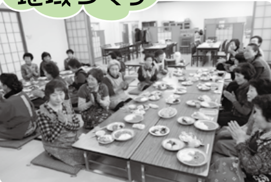
今年度の作業報告を行い、収穫した野菜で作った料理を頂きながら親睦を深めています

雄勝地域では、グラウンドゴルフや収穫祭を通じて、気軽に交流できる地域の拠点づくりに取り組んでまいりました。 9月29日（土）26名が参加し院内地区グラウンドゴルフ大会を開催しました。参加者の中で最高齢の方は、97歳。活気ある大会となりました。 10月31日（水）小雨の降る天候ではありましたが32名が参加し横堀地区グラウンドゴルフ大会を開催しました。また、今年度新たな取り組みとして始まった「畑サロン」も収穫祭を迎え喜びもひとしお賑やかなサロンとなりました。30年度（12月現在）は、45町内会で、特色のあるサロン活動を展開しています。