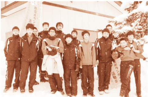
除雪ボランティア隊