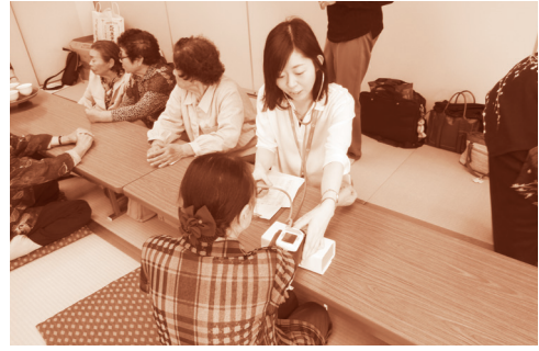
やまどりの会（雄勝）